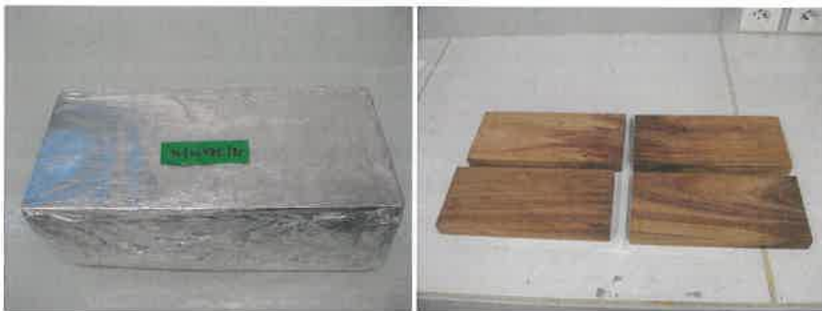
Photo 1 : Echantillons à réception (gauche) et après déballage (droite)

Prélèvement effectué par : l'échantillonnage et le prélèvement ont été réalisés par la société SCIAGES DE BOURBON.