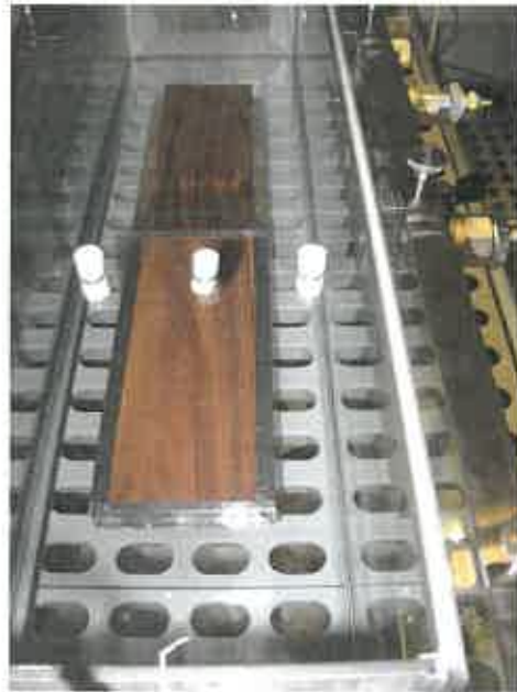
Photo 3 : Eprouvettes conditionnées dans la chambre d'essai d'émission

Les conditions de l'essai ont été sélectionnées selon les recommandations de la norme NF EN ISO 16000-9 (tableau 2).